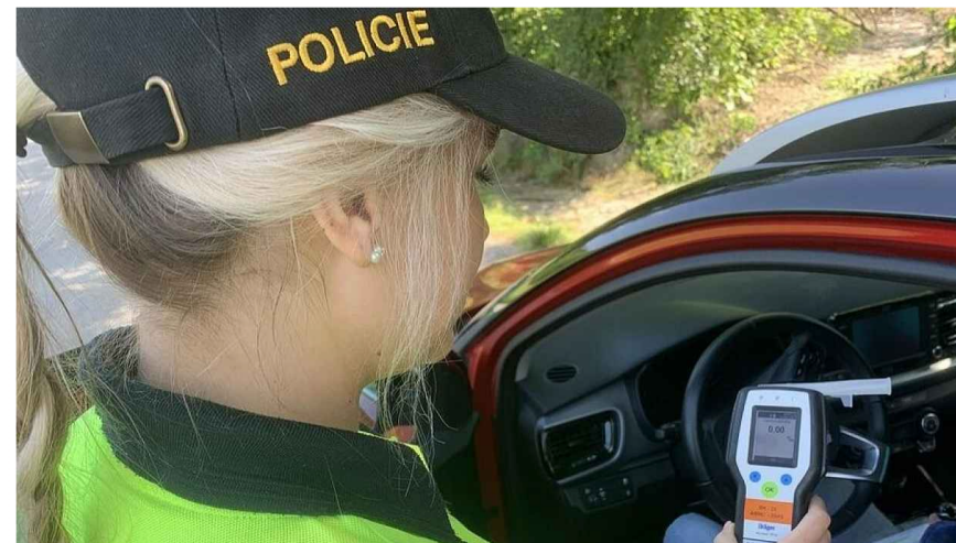
Nejčastěji se s kontrolou alkoholu setkáváme po zastavení hlídkou dopravní policie

Zatímco v mnoha zemích světa je řízení s nízkou hladinou alkoholu v krvi povolené, u nás musí být řidič naprosto střízlivý. Jenže, fakticky to tak úplně neplatí... Přinášíme odpovědi na osm důležitých otázek, které souvisí s tím, kdo a jak může řidičům kontrolovat alkohol či jaké za to hrozí postihy.