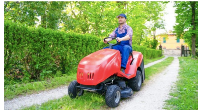
Do nové definice vozidla pro povinné ručení spadá i domácí traktůrek. (ilustrační foto)

Pravděpodobně se změní i termín, ve kterém úpravy očekáváme. „Datum účinnosti je v návrhu zákona sice stanoveno na 23. prosince 2023, ale legislativní proces ještě není ukončen, v polovině listopadu nás čeká teprve druhé čtení.